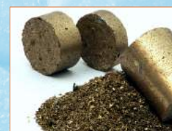
Bricchette di ottone/rame Briquettes made of brass/copper

A complete automatized system of the entire process can be projected and supplied upon request.