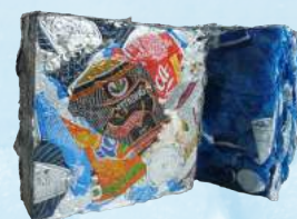
Lattine di alluminio e bottiglie di plastica Aluminium cans and plastic bottles