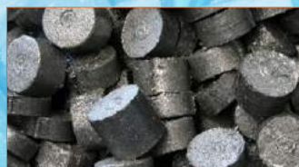
Bricchette di acciaio e ghisa Briquettes made of steel and cast iron