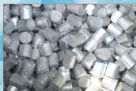
Bricchette di alluminio Briquettes made of Aluminium